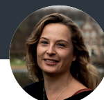
Eline de Vries Health Campus Den Haag